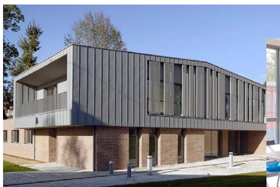
Entrée de la MSP ↗