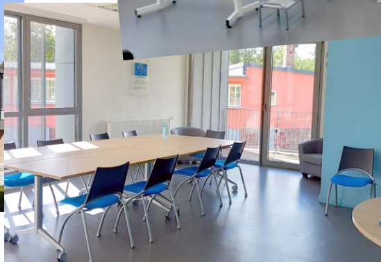
↖ Salle de consultation